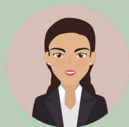
A. – Projektleiterin, Übersetzungsbüro in Deutschland

Geneviève ist eine Expertin für Übersetzung und TM-Tools. Sie ist sehr organisiert und absolut zuverlässig.