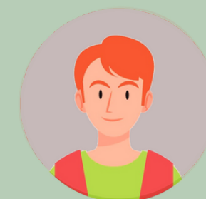
T. – Lokalisierungsingenieur, Übersetzungagentur in Tschechien

Professionell, erfahren, zuverlässig, immer hilfsbereit.